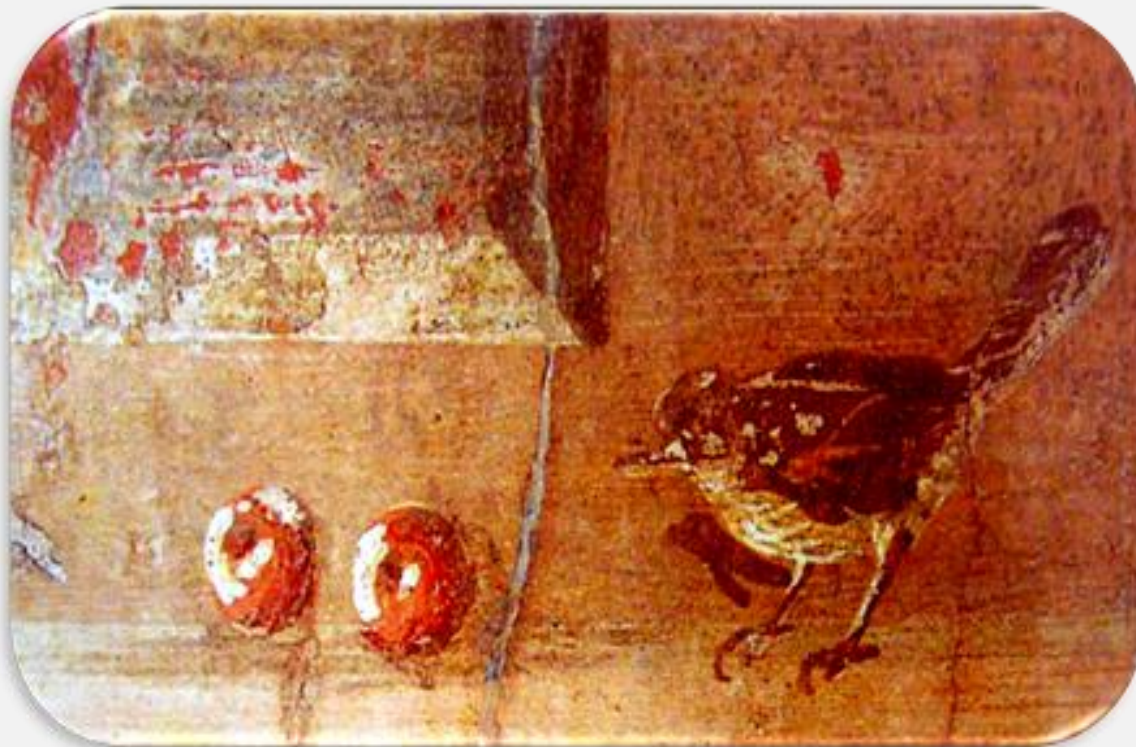
Pompei, Casa delle Quadrighe, I sec. d.C.