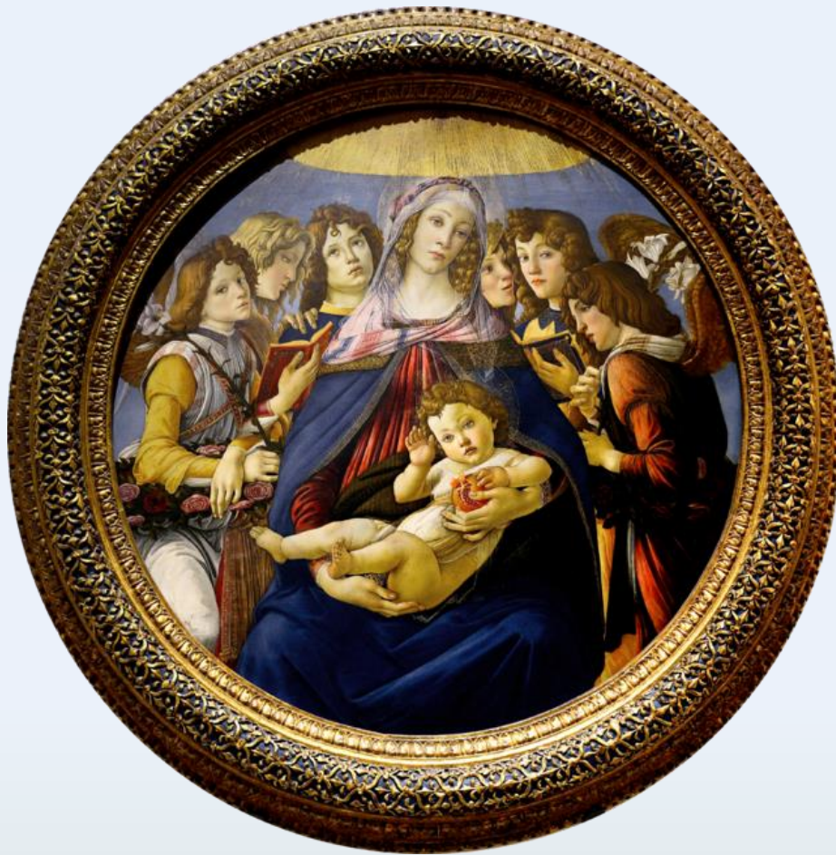
La Madonna della Melagrana (1487) - Sandro Botticelli